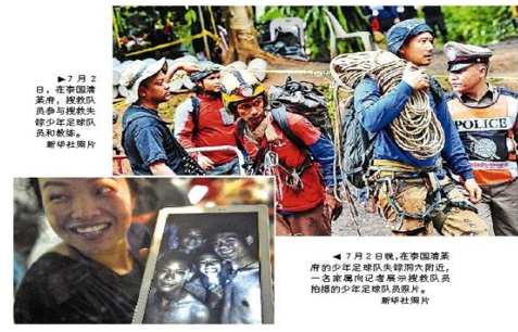
▲7月2日,在泰国清迈,救援队成员和获救的少年足球队成员合影。

【新华社曼谷7月3日电】泰国政府官员3日说,被救获的泰国少年足球队成员安全,目前救援队在洞穴下一步营救方案。 泰国政府官员说,在泰国北部清迈省的一个洞穴中,被困的少年足球队成员安全,目前救援队在洞穴下一步营救方案。 泰国政府官员说,在泰国北部清迈省的一个洞穴中,被困的少年足球队成员安全,目前救援队在洞穴下一步营救方案。